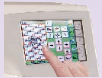
Écran couleur LCD tactile haute résolution (320 x 240 pixels - 4096 couleurs)