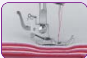
Couture dans les tissus épais grâce à la double hauteur du pied de biche et à la puissance de piqûre