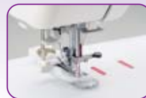
Boutonnière automatique en une phase à la taille du bouton , installez le à l'arrière du pied et réalisez une boutonnière impeccable en une seule opération