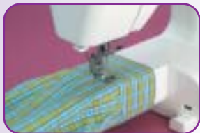
Bras libre pour les coutures circulaires (bas de pantalons manches...)