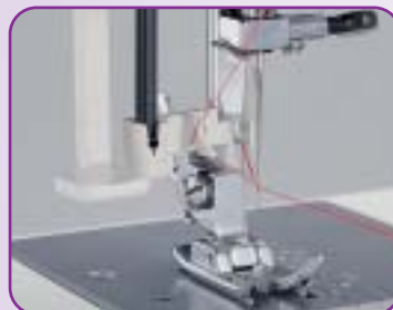
Enfilage automatique de l'aiguille