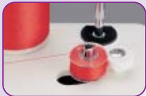
Débrayage automatique de la canette