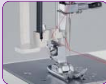
Enfilage automatique de l'aiguille