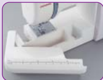
Table de couture avec les indications en inch et cm