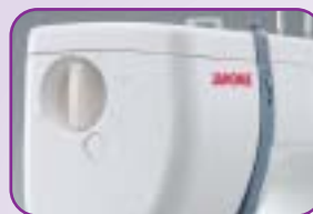
Pression du pied de biche réglable : Permet un entraînement régulier des tissus épais ou très fins et des tissus extensibles