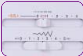
Réglage longueur et largeur des points